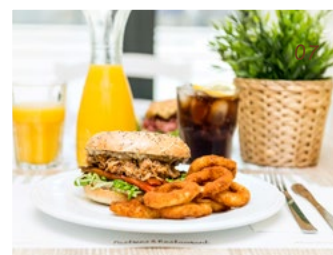
01 EGG BENEDICT PLATE - 02 PASTRAMI BAGEL - 03 CHICKEN WAFFLE - 04 SCRAMBLES EGGS AND TOAST - 05 RICE BOWL - 06 SALMON SALAD - 07 PULLED PORK BAGEL

Servizio: € 1,50 a persona per cena e brunch